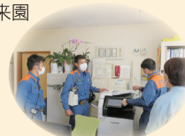
各棟の点検中です