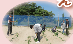
今年もたくさん採れるといいね！ 今年も見事な出来ばえです