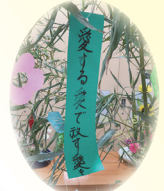
願い事を書きました