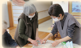
ここはこうするとさらに よくなるよ