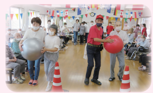
職員と一緒にガンバレ!ガンバレ!