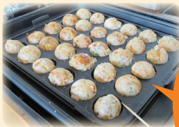
料理長の腕の見せ所