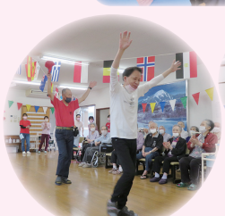
バンザイ優勝だー!