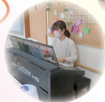
バックミュージックは職員です