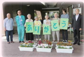
今年もありがとうございました