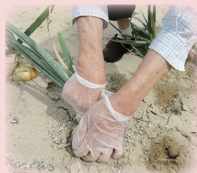
大きくできたかな？