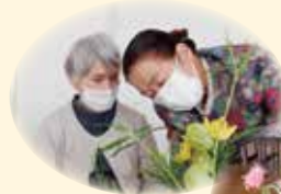
やっぱり先生に 直してもらおうと いいわー