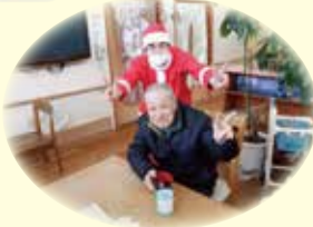
久しぶりのクリスマス