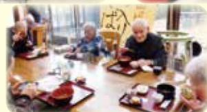
今年もおいしいそばが食べられました