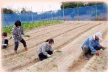
いい玉ねぎができますように!