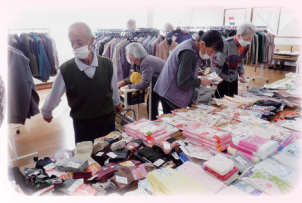
どれがいいか 選んでよー