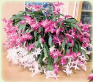
シャコバサボテン