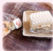
食後のお茶タイム