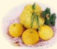
鬼ゆず、マルメラ、夏みかん