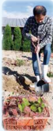
包丁をスコップに かえて ヨイショ!