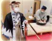
今年の大石内蔵助は誰？