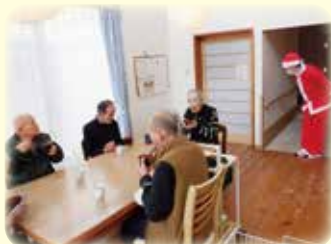
ケーキではなくぜんざいです