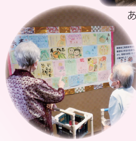
皆さん上手ですね