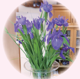
季節はずれの カキツバタです きれいですね