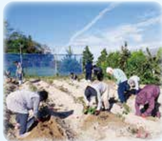
みんなでほりました