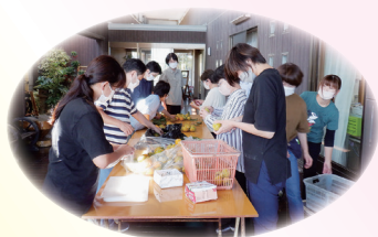
職員も総出で作りました