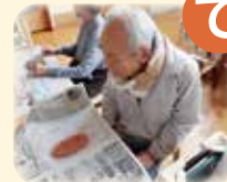
僕ははじめて作ります