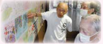
きれいな絵!感謝です!