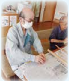
字を書いてほります