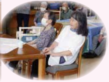
皆さん上手に歌われるね!