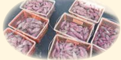
どっさり収穫しました！