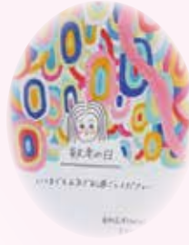
カラフルでいいですね