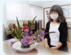
うまく出来ました