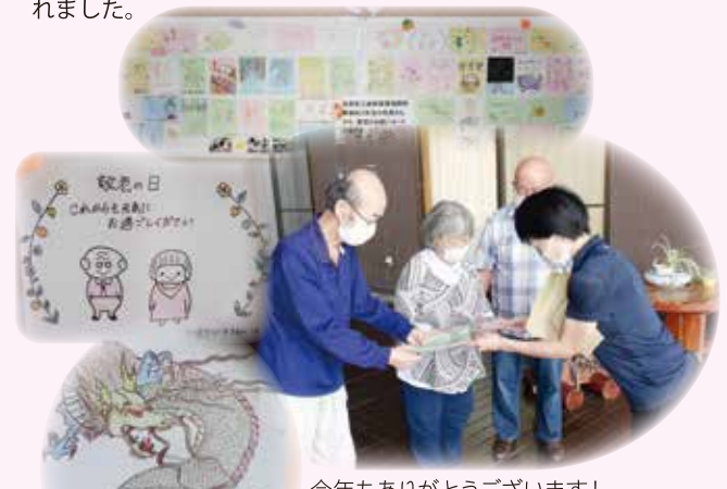
今年もありがとうございます!

島根県立東部高等技術校の生徒の皆さまより、敬老の日に 素敵な絵はがきを頂きました。昨年にも頂き、楽しみにしておら れました。