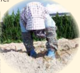
ヤル気マンマンです