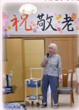
和光園ナンバーワンですね!